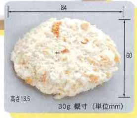
60g 93×71×21.5 概寸(単位mm)