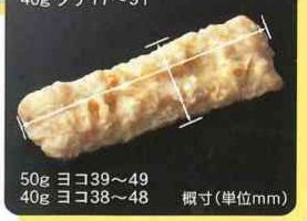
50g ヨコ39~49 40g ヨコ38~48 概寸(単位mm)

亜鉛、鉄分、カルシウムを簡単に摂取できます。国内工場生産しています。お客様にも食べやすい商品で、化学調味料は使用していません。