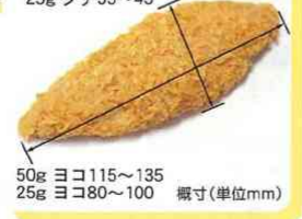
50g ヨコ115~135 25g ヨコ80~100 概寸(単位mm)

南半球で漁獲し急速凍結されたほきをフライにしました。肉質は淡白で魚臭さがありません。