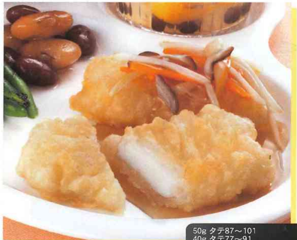
50g タテ87~101 40g タテ77~91